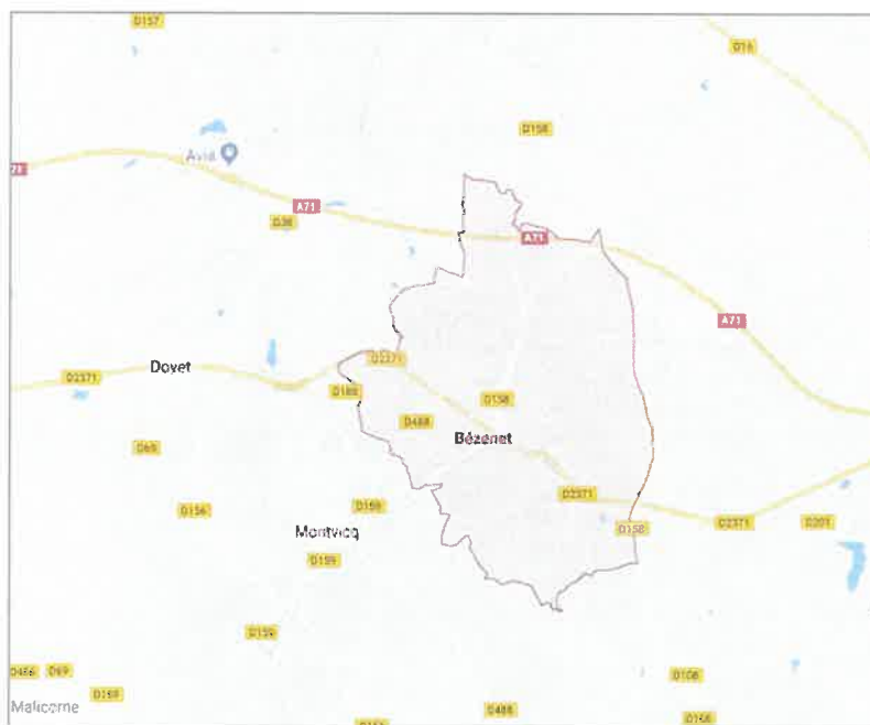
Figure 1 : Plan de situation et plan de la commune de BEZENET